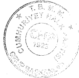
Dr. M. Sezgin TANRIKULU İstanbul milletvekili