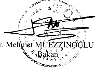
Dr. Mehmet MUEZZINOGLU Bakan