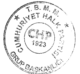
Dr. M. Sezgin TANRIKULU İstanbul milletvekili